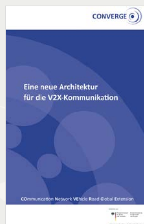
Abbildung 3: Titelseite der aktuellen CONVERGE-Broschüre